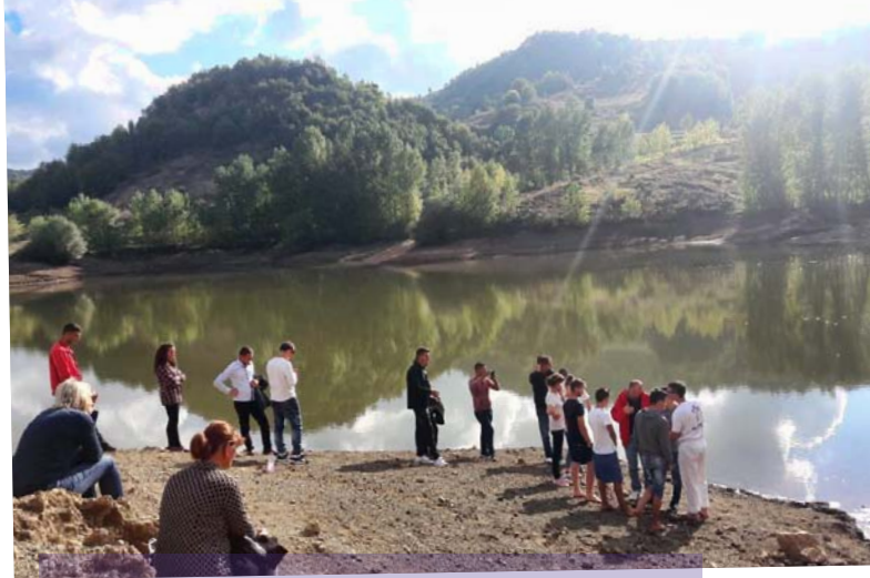
Sechs neue Gläubige aus den Mokrabergen, vor allem Jugendliche, wurden Anfang Oktober getauft

Während der Sommerferien hat ein Team einer Baptistengemeinde aus Florida, gemeinsam mit albanischen Ehrenamtlichen aus Tirana, eine Kinderwoche in den Bergdörfern veranstaltet. Über 150 Kinder und Jugendliche kamen jeden Nachmittag zusammen, um miteinander zu spielen, aber auch von Jesus Christus zu hören. Ein weiterer Höhepunkt war der Taufgottesdienst am 1. Oktober: Zunächst feierten wir in der Kirche in Bishnica, dann ging es zum Stausee nach Buzaishtë, wo die Taufe vollzogen wurde. Solch ein äußerlich sichtbares Zeichen des Bekenntnisses und der Gnade Gottes ist gerade für die Menschen in der archaischen Kultur der albanischen Bergdörfer sehr wichtig.