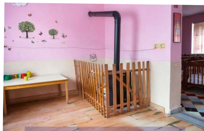
Die abgenutzten Böden im Kindergarten Librazhd werden im August erneuert