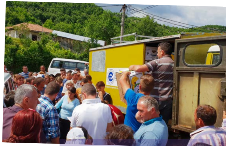
Verteilen von Familienpaketen in Buzaishtë