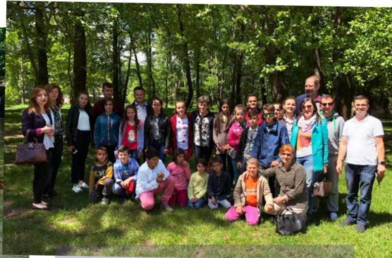
Bilder vom Ausflug der Internatskinder und -mitarbeiter nach Pogradec an den Ohridsee