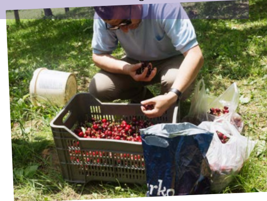
Frisch geerntete Kirschen, eine der wenigen einheimischen Sachspenden aus der armen Mokra-Region