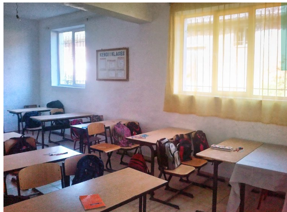
Vorher und nachher: Klassenzimmer im Gymnasium von Proptisht

Die CHW-Wanderausstellung informiert dreisprachig über das Leben in Albanien und über unsere Arbeit. Sie können sie in Ihrer Kirche, Firma, Schule etc. zeigen – sprechen Sie uns an.