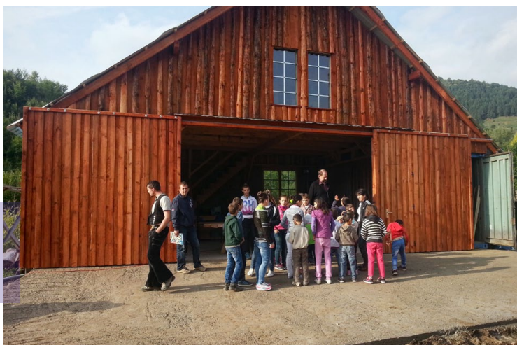
Junge Handwerker aus dem Erzgebirge haben diesen Bau komplett neu erstellt – vom Fundament bis zum Dach