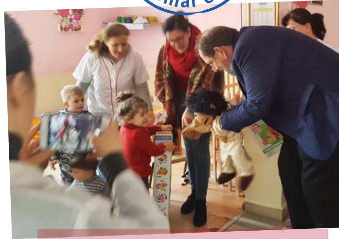
März 2018: Übergabe gespendeter Spielsachen und Kinderkleidung für einen Kindergarten in Librazhd

Falls Sie bei der nächsten Verteilaktion dabei sein möchten, können Sie sich schon jetzt bei mir anmelden. Allgemeine Teilnehmerinfos finden Sie unter www.chwev.de/de/mitmachen/einsaetze