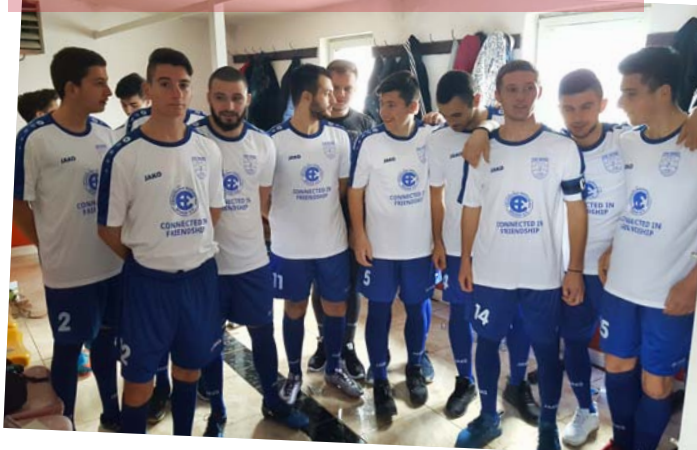
Die Worte „In Freundschaft verbunden“ und das CHW-Logo zieren die neuen Trikots der Fußballmannschaft von Ohrid