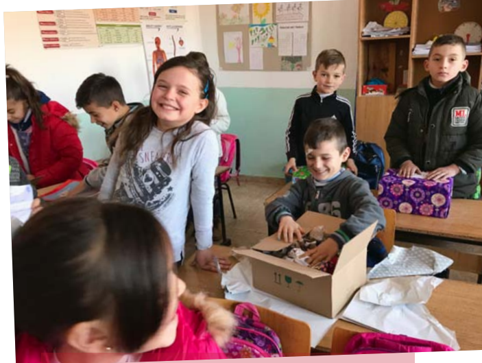
Kinder in der Schule von Zall-Torrë packen fröhlich ihre Weihnachtspäckchen aus