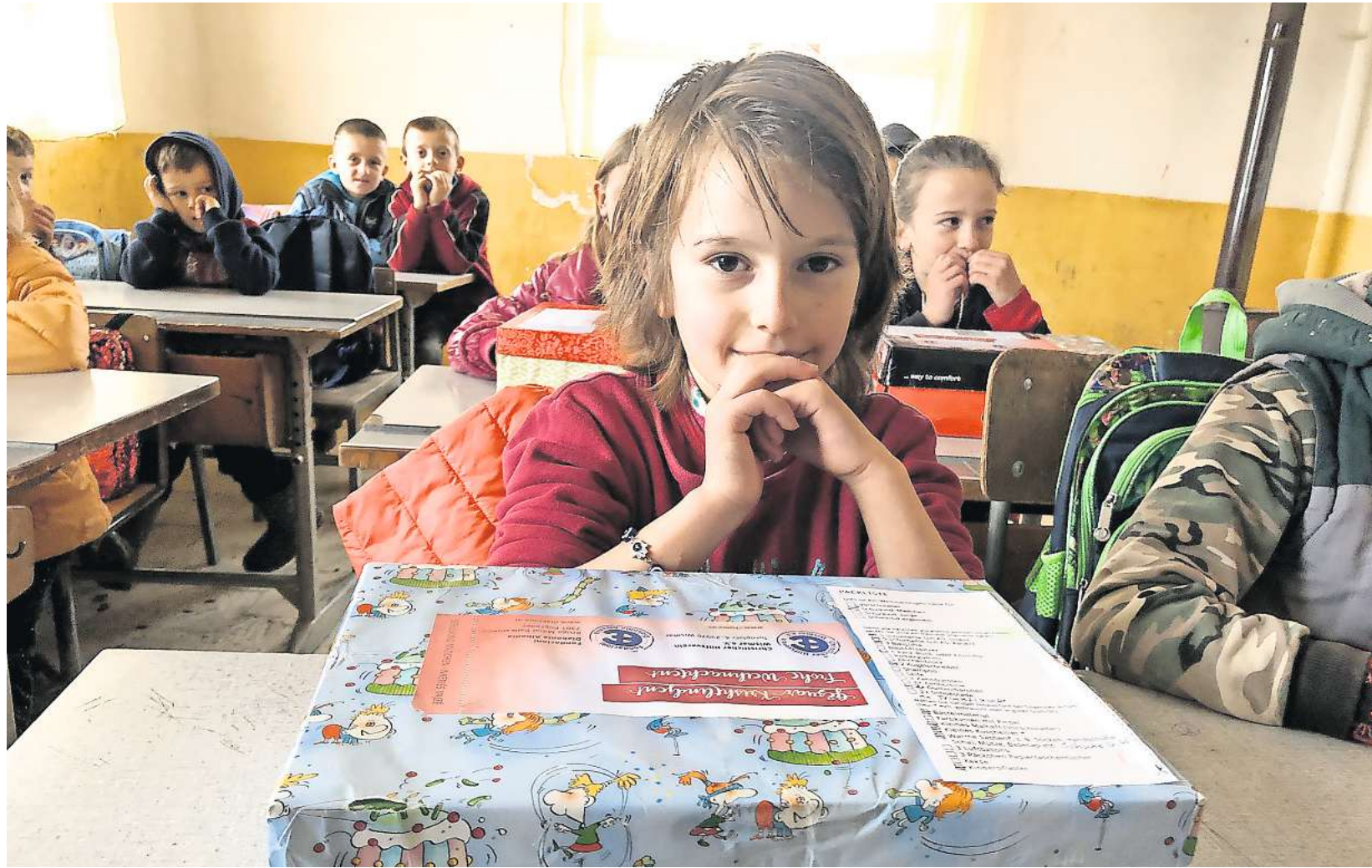
Seit Jahren freuen sich die Kinder in den armen Regionen Albaniens über die Weihnachtspakete aus Deutschland.

Die Schulmaterialien in jedem Paket unterstützt die ganze Familie. Die Lebenshaltungskosten sind nur etwas niedriger als in Deutschland,